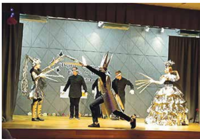
Konverentsi avas etendus „Voyager“.