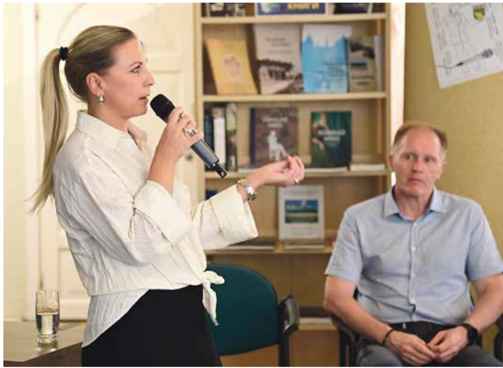
Vallavanem tutvustas rahulolu-uuringu tulemusi keskraamatukogus, kus arutati valla arengu üle.